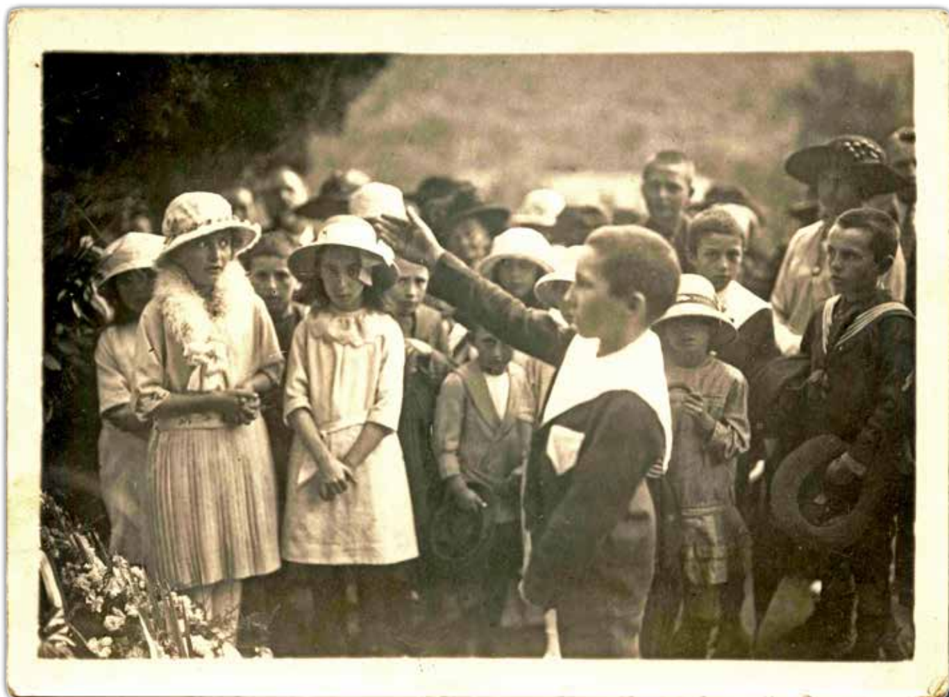
Un enfant récite un poème en l'honneur des héros